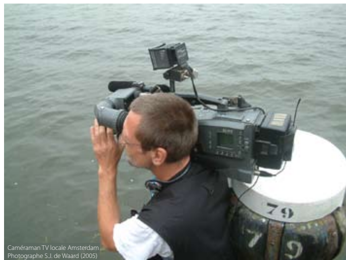
Caméraman TV locale Amsterdam Photographe S.J. de Waard (2005)

Les liens entre le cinéma et l'histoire se sont accrus avec l'arrivée de la télévision. Auparavant, les gouvernements utilisaient les cinémas à leurs avantages pour diffuser de l'information. Dans les années 60, les documentaires furent de moins en moins présents dans les salles et furent récupérés par la télévision, au point de voir naître par la suite un genre nouveau : le reportage et le documentaire aux actualités du journal télévisé.