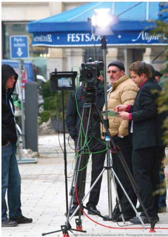
46th Munich Security Conference 2010