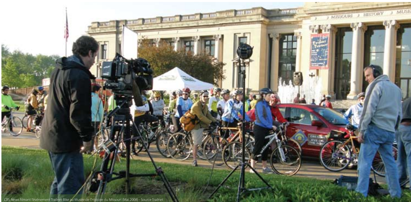
CBS News filant l'événement Trailnet Bike au Musée de l'Histoire du Missouri (Mai 2008)