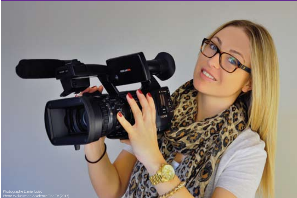
Photographe Daniel Loizo Photo exclusive de AcademieCine.TV (2013)